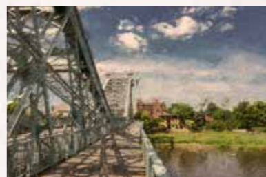
12 Loschwitzgrund Körnerplatz am Blauen Wunder Buslinien 61, 63, 84, 521 bis „Körnerplatz“