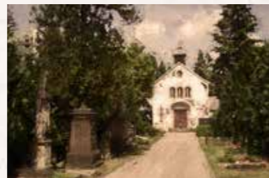
2 Dresdner Friedrichstadt Friedrichstraße 54, 01067 Dresden Straßenbahnlinie 10 bis „Krankenhaus Friedrichstadt“