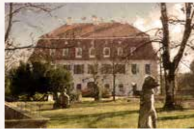
19 Schloss Siebeneichen und Schloss Scharfenberg Siebeneichener Schlossberg 2, 01662 Meißen Scharfenberg, Schloßweg 1, 01665 Klipphausen