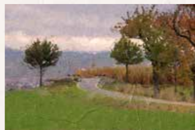
14 Schönfeld mit Rockauer Höhe Rockauer Ring 35, 01328 Dresden Buslinie 98B bis „Am Preßgrund“