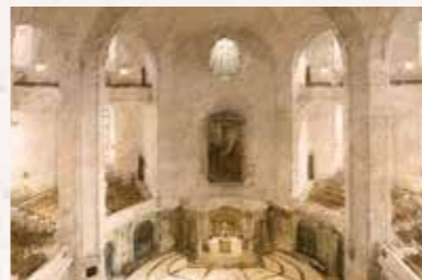
4 Kreuzkirche An der Kreuzkirche 1, 01067 Dresden Straßenbahnlinien 1, 2, 4 bis „Altmarkt“