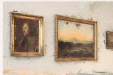
9 Kugelgenhaus Hauptstraße 13, 01097 Dresden Straßenbahn 4, 8, 9 bis „Neustädter Markt“