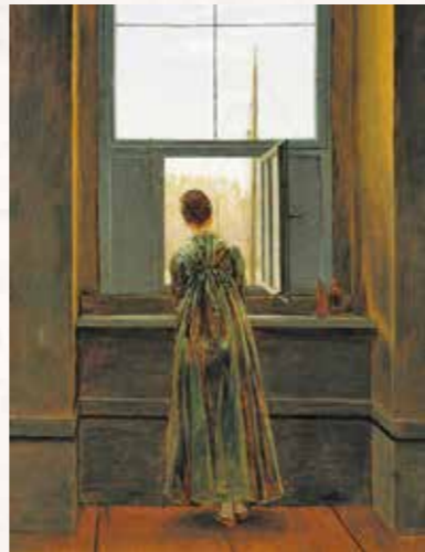
Caspar David Friedrich: „Frau am Fenster“ (zwischen 1818 und 1822)

Fähigkeit, Natur und Romantik in der Kunst so zu vereinen, dass sie uns bis heute tief berührt.