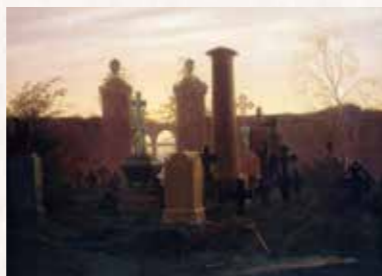
Caspar David Friedrich: „Kügelgens Grab“ (1821/1822)

Von der Brühlschen Terrasse, auch der „Balkon Europas“ genannt, bietet sich Ihnen eine malerische Aussicht auf Dresden und die sich durch die Stadt schlängelnde Elbe. Hier erinnert ein Denkmal an Caspar David Friedrich, der als außerordentlicher Professor an der benachbarten und hoch angesehenen Kunstakademie wirkte. Das Denkmal ist dem Gemälde „Caspar David Friedrich in seinem Atelier“ von Georg Friedrich Kerstings nachempfunden. Seinerzeit stand an dieser Stelle, im Brühlschen Garten, ein herrliches Belvedere mit Gondelhafen, das Friedrich zeichnete.