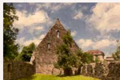
16 Klosterpark Altzella Zellaer Straße 10, 01683 Nossen Buslinie 424 bis „Nossen“