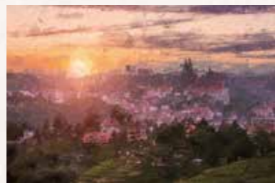
18 Meißen 01662 Meißen, S-Bahn bis Meißen