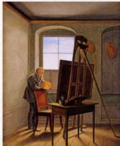
Georg Friedrich Kersting: „Caspar David Friedrich in seinem Atelier“ (um 1812)