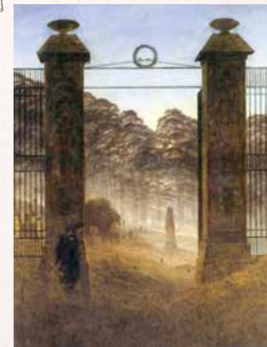
Caspar David Friedrich: „Der Friedhof“, unvollendet (um 1825)

Hier genoss Friedrich die faszinierende Aussicht über Dresden bis weit in die Sächsische Schweiz. Seine Skizzen dienten später als Grundlage für einige seiner Gemälde. Der Name der Anhöhe entstand vermutlich durch die mundartliche Aussprache der Bezeichnung „Sachsens Hügel“. Von hier aus ist es nicht mehr weit bis in die historische Altstadt von Pirna und in die Sächsische Schweiz, wo die Caspar-David-Friedrich-Geschichte mit Sonderausstellungen, Veranstaltungen und Aufführungen, etwa „Friedrich trifft Wagner“ in den Richard-Wagner-Stätten Graupa, weitererzählt wird.