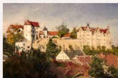
17 Schloss Nossen Am Schloß 3, 01683 Nossen Buslinie 424 bis „Nossen“