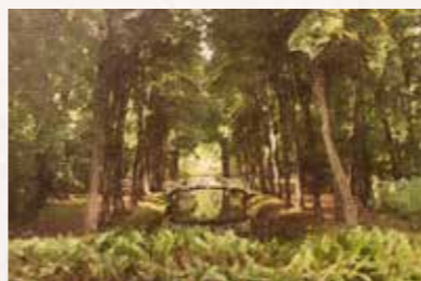
15 Seifersdorfer Tal 01465 Wachau S-Bahn bis Bahnhof Langebrück