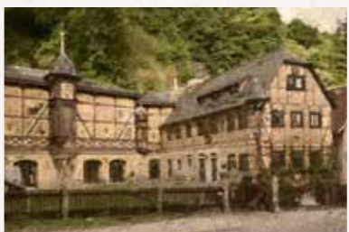
13 Leonhardi-Museum Grundstraße 26, 01326 Dresden Buslinien 61, 63, 84, 521 bis „Körnerplatz“