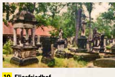
10 Eliasfriedhof Ziegelstraße 22, 01069 Dresden Straßenbahnlinien 6, 13 bis „Sachsenallee“