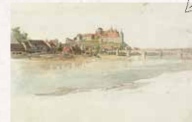
Caspar David Friedrich: „Blick auf Meißen“ (um 1824)

Malerische mittelalterliche Gassen, eine majestätische Burg, verträumte Cafés und Weinberge. Caspar David Friedrich liebte Meißen und das nahegelegene Kloster Heilig Kreuz. Mehrere Zeichnungen entstanden hier. Sein Aquarell „Blick auf Meißen“ zeigt die Stadt vom rechten Elbufer aus.