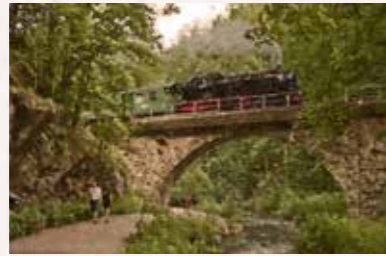
20 Plauenscher Grund Freital Altplauen 21, 01187 Dresden Buslinie 62 bis „S-Bahnhof Plauen“