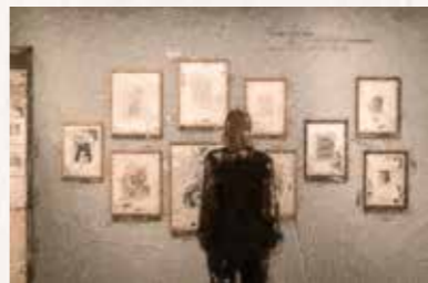
5 Kupferstich-Kabinett Schlossstraße, 01067 Dresden Straßenbahnlinien 1, 2, 4, 8, 9, 11, 12 bis „Postplatz“