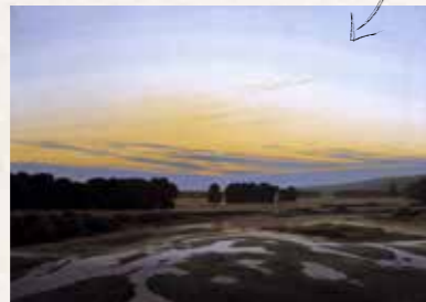
Caspar David Friedrich: „Das Große Gehege“ (etwa 1832)

Friedrichs berühmtes Gemälde „Das Große Gehege bei Dresden“ (1831/32) könnte die 1725 angelegte Lindenallee entlang der Pieschener Allee zeigen, wo man noch heute einige Altbäume findet. Die Allee führte zur historischen Fährstelle nach Pieschen, einem ehemaligen Fischerdorf, heute ein Dresdner Stadtteil. Das Ostragehege ist Teil der breiten Auenlandschaft der Elbe. Benannt ist es nach dem Dorf Ostra, das 1206 erstmals erwähnt wurde. Der aus dem Sorbischen stammende Name Ostra bedeutet „Insel“. Das Gemälde könnte die Perspektive von der Neustädter Seite zeigen, welche heute etwa auf Höhe des Traditionslokals „Lindenschänke Dresden“ liegt.