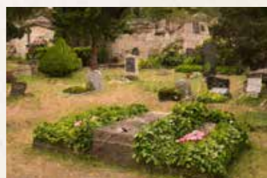
11 Trinitatisfriedhof Fiedlerstraße 1, 01307 Dresden Straßenbahnlinie 6 bis „Trinitatisplatz“