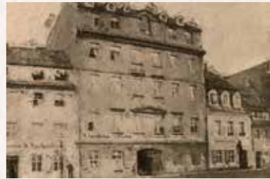
8 Friedrichs Wohnquartier Höhe Terrassenufer 13, 01067 Dresden Straßenbahnlinie 3, 7 bis „Synagoge“