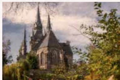
3 Briesnitzer Friedhof Merbitzer Str. 21, 01157 Dresden Buslinie 58 bis „Merbitzer Straße“