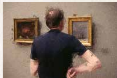
7 Albertinum Tzschirnerplatz 2, 01067 Dresden Straßenbahnlinien 1, 2, 3, 4, 7, 12 bis „Pirnaischer Platz“